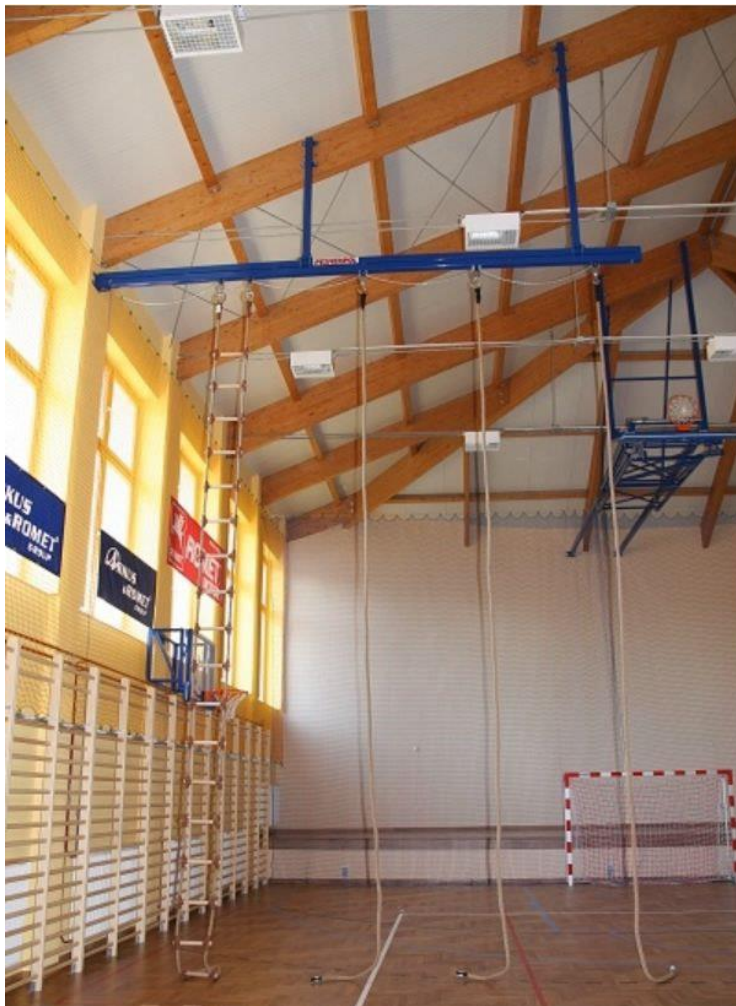
Lana standartní pro šplh, 6,0m, ilustrační

Pojzdová kolejnice určená k zavěšení lan, tyčí, kruhů a provazových gymnastických žebříků. Pojízdný systém upevněný na speciální kolejnici. Rozkládání probíhá tak, že se potáhne první gymnastické lano směrem ke středu haly, jakmile systém dojede na konec kolejnice, sám se zabrzdí, čímž zajistí bezpečné používání. Skládání probíhá tak, že se stáhne zavěšené gymnastické pomůcky šňůrkou ke stěně a šňůrka se pak přiváže k háčku umístěným na stěně. Montáž kolejnice je individuálně přizpůsobená každému druhu střešní konstrukce – v tomto případě k ocelovému obloukovému segmentu zastřešení pomoci šroubů, vymezení výšky pohledu. Ilustrační foto: