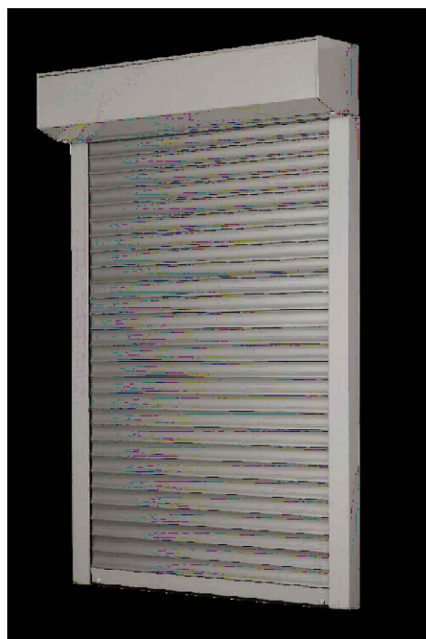
PŘÍKLAD: HORIZONTÁLNÍ LAMELOVÁ ROLETA